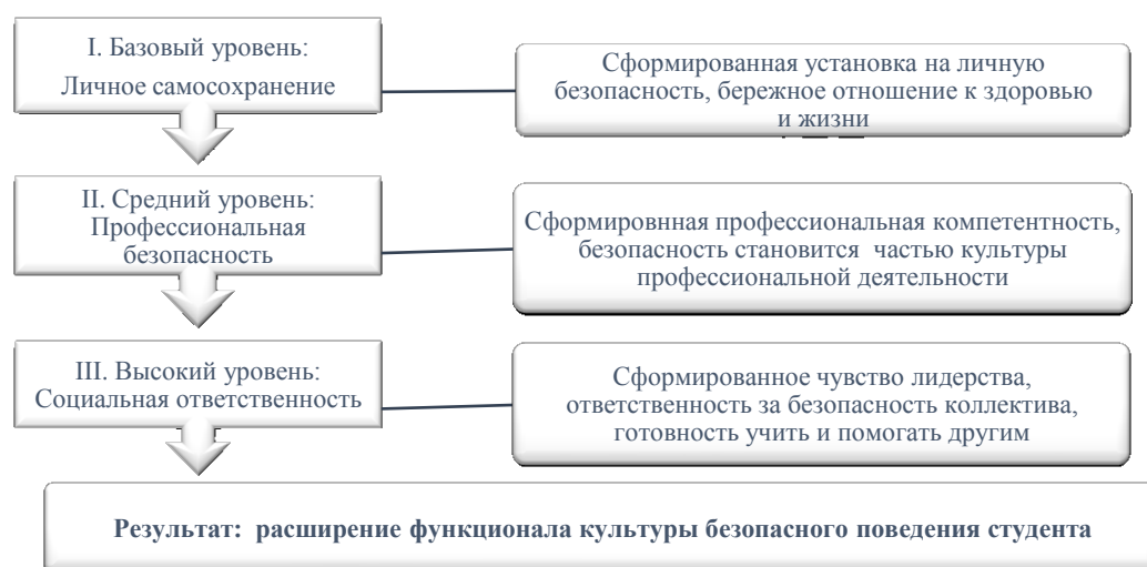
Рис. 1. Уровни сформированности культуры безопасного поведения

В данном исследовании была разработана и реализована комплексная программа формирования культуры безопасного поведения студентов вуза, сочетающая различные виды социальных практик (Девяткина 2025). Проведение социальных практик, согласно комплексной программе, обеспечивало три уровня сформированности культуры безопасного поведения студента (рис. 1).