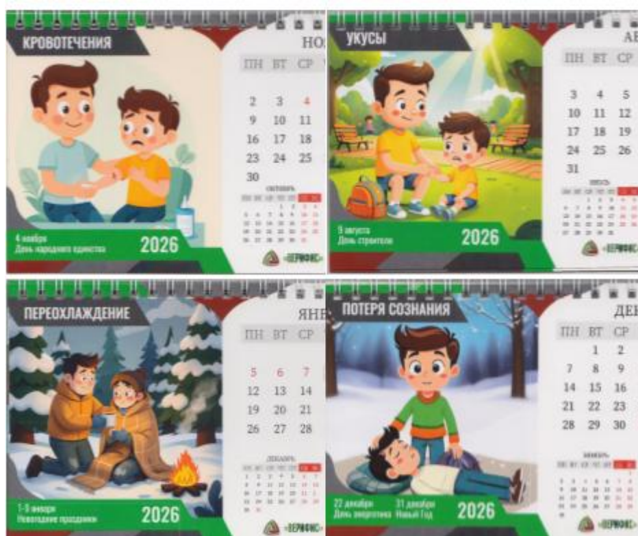
Рис. 3. Социальная практика «Календарь безопасности» совместно с АНО ДПО «Верифис»

В эксперименте на первом этапе реализованы социальные практики, включающие пространства и инструменты, направленные на личный опыт и знания в сфере безопасного поведения. Они способствовали переводу общего представления о безопасности в личное смысловое поле. Интерес студентов вызывали социальные практики, разработки и распространения в вузе и среди населения иллюстрированных календарей безопасности АНО ДПО «Верифис» (Репях, Белоновская 2018) (рис. 3).