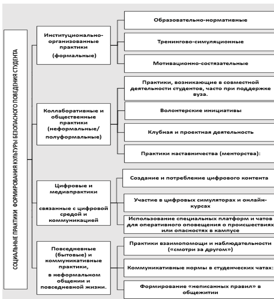
Рис. 2. Классификация социальных практик, реализованных в целях формирования культуры безопасного поведения студента вуза

В авторском экспериментальном исследовании на базе Бузулукского гуманитарно-технологического института (филиала) Оренбургского государственного университета общее количество респондентов составило 312 человек, обучающихся по очной (197 человек, 63 %) и очно-заочной (115 человек, 37 %) формам, представляющих 8 направлений подготовки института. Была реализована комплексная программа социальных практик.