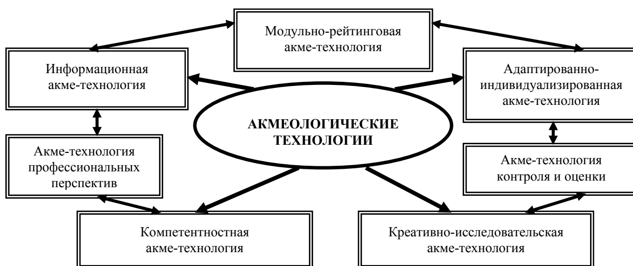
Акмеологические технологии продуктивного развития профессиональной компетентности будущего специалиста

вышение профессионализма и адаптационных возможностей. Основной задачей акмеологических технологий является не просто дать будущим специалистам профессиональные знания и умения, а прежде всего сформировать и закрепить в сознании студентов необходимость в саморазвитии и самореализации, то есть в самосовершенствовании личностного и профессионального «Я». Результаты эмпирических исследований позволили выявить следующие акме-технологии продуктивного развития профессиональной компетентности как практико-ориентированного конструкта (см. рисунок). Предлагается рассмотреть их сущностные характеристики.