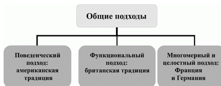
Зарубежные подходы к определению и выделению кластеров компетенций

включается дополнительно самокомпетенция, которая определяется как способность личности к отстаиванию положительного «Я-образа» и развитию нравственности, взаимодействию с другими членами общества рациональным и честным способом, включающим развитие чувства социальной ответственности и солидарности. В настоящее время в Германии выделено более трехсот профилей профессиональной подготовки, описанных по общему формату в рамках компетентностного подхода и включающих компетенции в рамках единого терминологического аппарата.