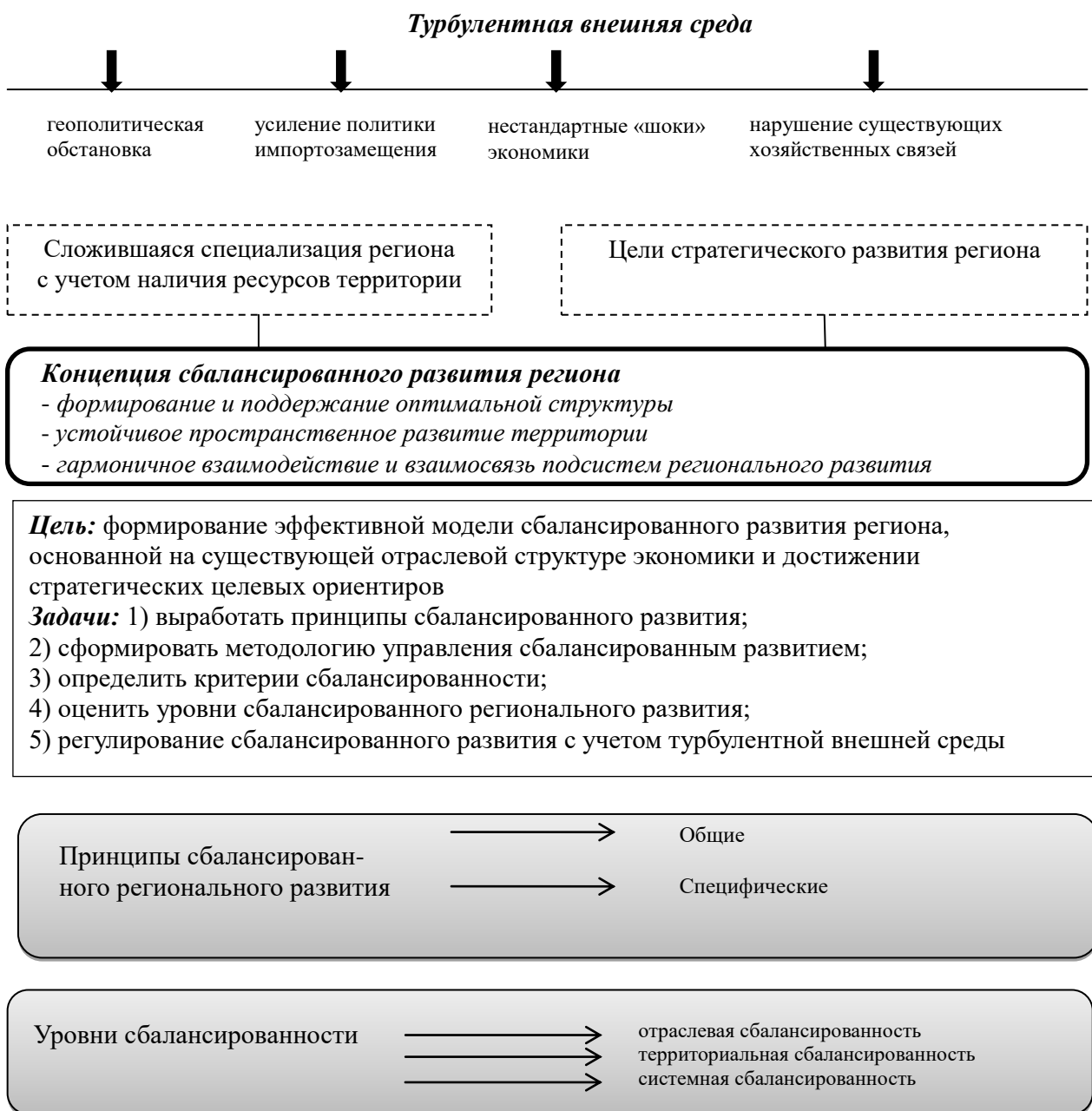
Рисунок 1 – Положения концепции сбалансированного развития региона в условиях турбулентной внешней среды

Для разработки основных положений концепции сбалансированного развития региона были систематизированы общие и специфические принципы сбалансированного развития региона, механизм сбалансированного развития с выявлением экзогенных и эндогенных факторов – катализаторов и ингибиторов сбалансированного регионального развития, совокупность критериев сбалансированного развития региона, позволяющая формировать адекватную реакцию территориальной системы на турбулентное воздействие внешней среды.