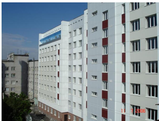
Административный корпус по ул. Социалистической. Архит. А. Перехоженцев.

В 1984-2017 гг. кафедру архитектуры возглавлял известный российский ученый в области проектирования ограждающих конструкций, член Союза архитекторов РФ, член градостроительного совета Волгограда, член диссертационного Совета по защите докторских диссертаций,