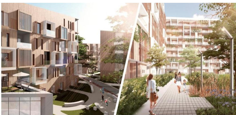
Проект мультикомфортной жилой застройки. Архит. Пересыпкина О.В., Мельникова О.Г.

преподавание архитектурного проектирования 1 и 2 уровня, основ компьютерного моделирования зданий и сооружений, основ профессиональной композиции и дипломное проектирование. Кроме этого занимается вопросами формирования