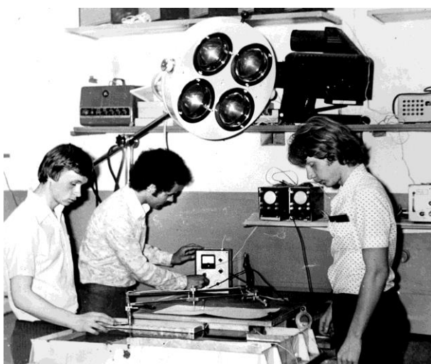
В лаборатории строительной физики. 1978 г.

факультете открыты новые специальности: «Дизайн архитектурной среды», «Проектирование зданий», «Монументально-декоративное искусство». В настоящее время профессор А.Г. Перехоженцев успешно передает свой богатый опыт студентам Института архитектуры и строительства. Имеет 135 научных работ, в том числе 2 монографии, 1 статья в зарубежном сборнике, 5 патентов. Под научным руководством А.Г. Перехоженцева защищено 4 кандидатских и