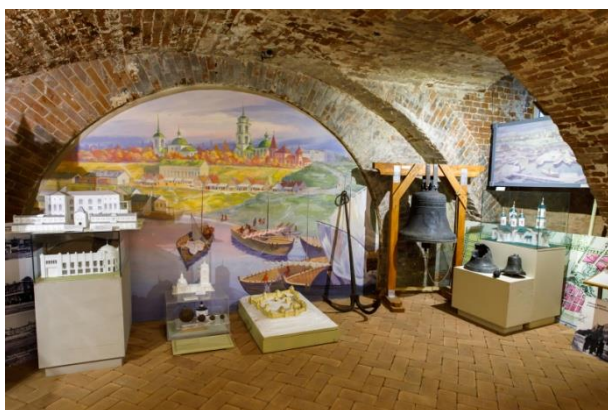
Музей архитектуры Царицына–Сталинграда–Волгограда